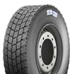
MULTI D M+S