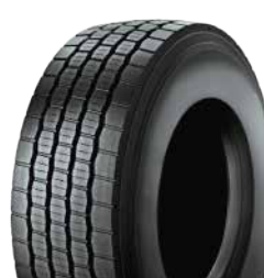
MULTI WINTER T M+S