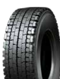
XDW ICE GRIP M+S