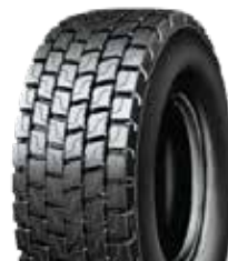
XDE2+ MT M+S