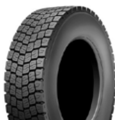
MULTI HD D M+S