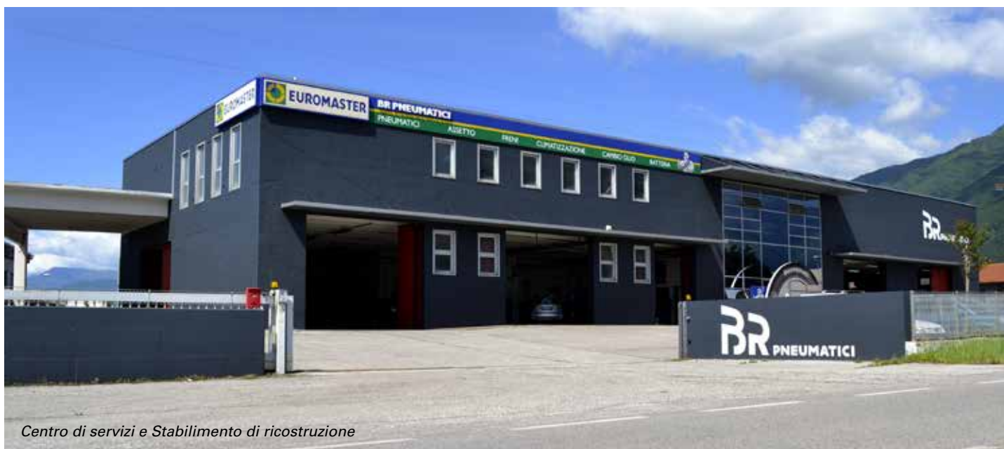
Centro di servizi e Stabilimento di ricostruzione