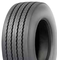
MULTI T M+S