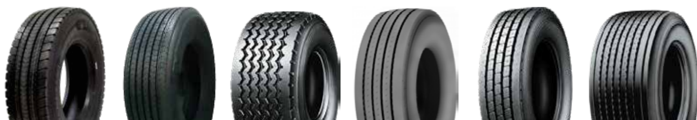
X LINE D Energy M+S