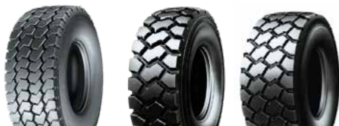
XTY B M+S