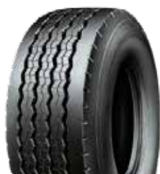
XTE2 B - XTE2 B M+S