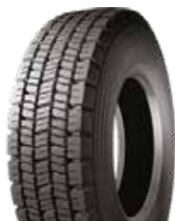
XDE2 LT M+S